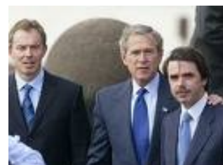
El trío Calavera de Las Azores

que dé clases de Ética el de la guerra de Irak venga ya, Don José Mari ¡ váyase usted a cagar !